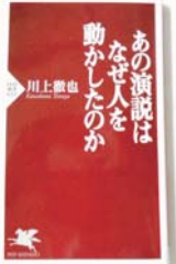
『あの演説はなぜ人を動かしたのか』 PHP新書

※古い本ですので新品は手に入りませんが、アマゾンならkindle、または中古本が購入できます。